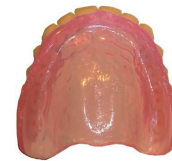
Prótesis completa para pacientes alérgicos o rompedentaduras.