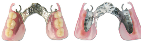
Prótesis bilateral combinada con metal.