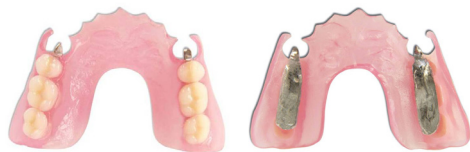
Prótesis bilateral con apoyos oclusales.