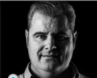
SR. CARLOS DE GRACIA CLÍNICA Y LABORATORIO, COMUNICACIÓN PARA LA EXCELENCIA: RESTAU- RACIONES ESTÉTICAS PERSONALIZADAS.